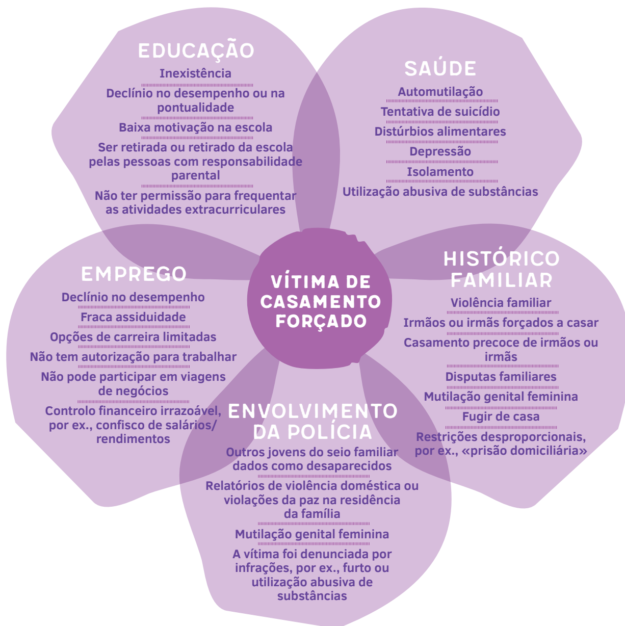
Quadro 1. Potenciais sinais de alerta ou indicadores de casamento forçado/precoce 15

Na página 14, o Roteiro da UE sobre o casamento forçado/precoce apresenta o processo em 7 passos que cada profissional da 1ª linha segue quando se vê confrontado com um potencial caso de casamento forçado/precoce.